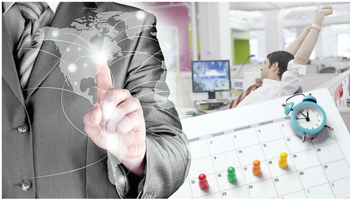
Еламп ҚАБА (Коллаж)

Испания, Исландия, Финляндия мен Біріккен Араб Әмірліктері қысқартылған жұмыс аптасына көшті. Жаңында бұл тізімге Бельгия да қосылды. Зерттеу нәтижелері бойынша, мұндай өзгерістен қызметкерлердің жұмыс сапасы артпаса, кемімеген. Осылайша, адам капиталын бірінші орынға қоятын Еуропа елдерінің тәжірибесі көп жұмыс істеуден гөрі тиімді еңбек етудің жөн екенін көрсетті. Төрт күндік жұмыстың тиімділігі қандай? Қазақстан қысқартылған жұмыс аптасына өтуі мүмкін бе?