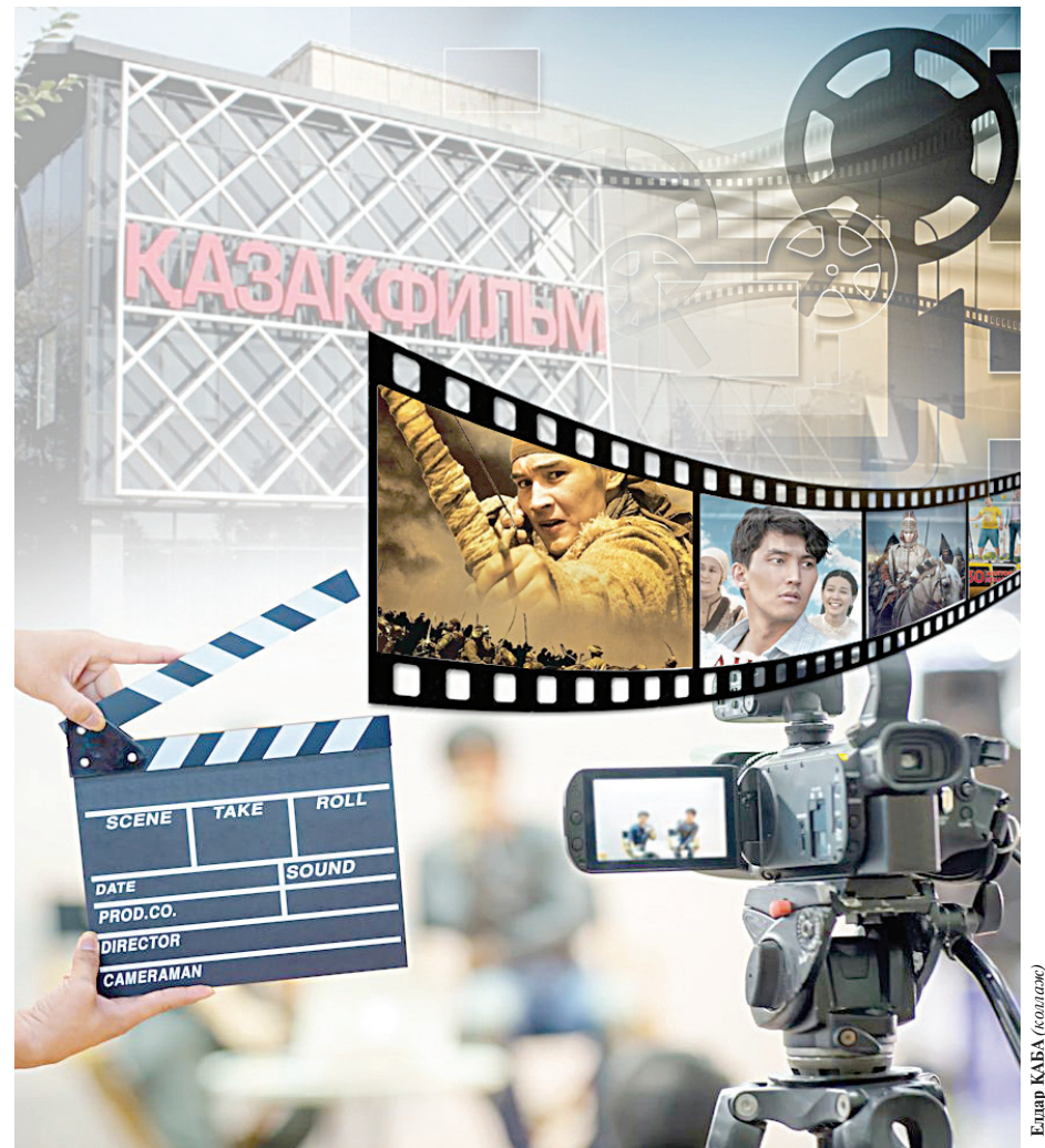
Еламп ҚАБА (Киногерлер)

Продюсер әзірге талқылау жүріп жатқанын, нақты қалай бекітілетінін