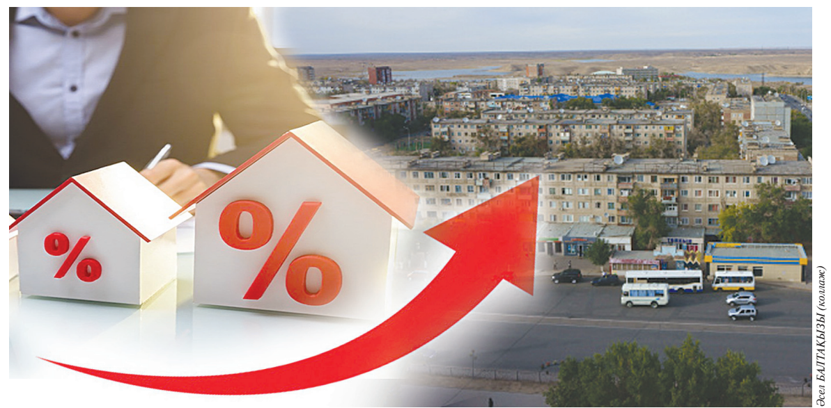
Өнер БАШТАҚЫЗЫ (Астана)

Моноқалалар проблемасы көп жылдар бойы көтеріліп келеді, бірақ одан тұрғындарының тұрмысы түзеліп, жағдайы жақсарып кете қойған жоқ. Жұмысшы қалашығының халқы жергілікті бірлі-жарым зауыттар мен кәсіпорындарда ауыр еңбекке жегіліп, күнкөрісі үшін содан тапқан азын-аулақ тиын-теңгеге қарап отыр. Расы сол, еліміздегі барша моноқалалардың өмір